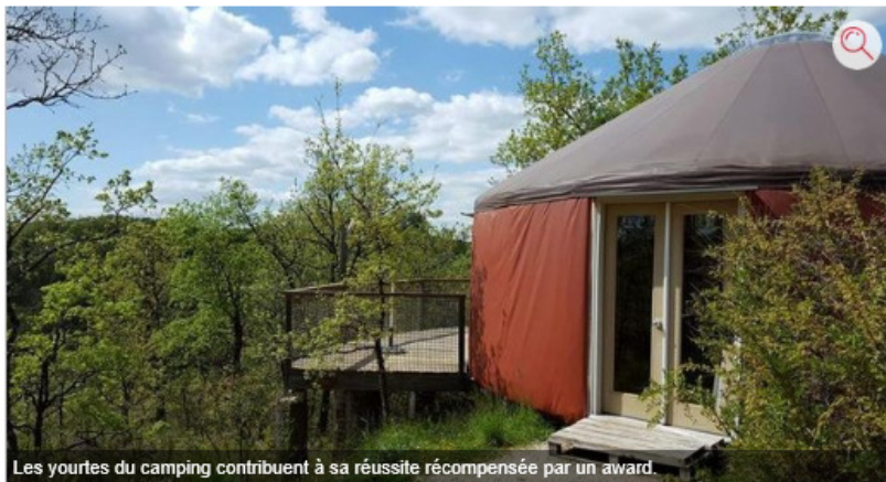
Les yourtes du camping contribuent à sa réussite récompensée par un award.

f Partager t Tweeter G+ Partager ✉ Commenter