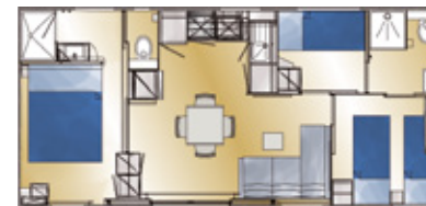
MAISON DES SABLES 6P/3 KMRS. PREMIUM - 40 M 2