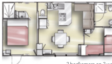
MAISON DES SABLES 5P/2 KMRS. PREMIUM - 35 M 2

Woonkamer met zit/slaapbank (2-persoonsbed, 140 cm)