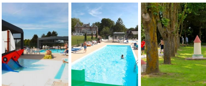
On ♥ la piscine couverte et l'environnement du domaine

Dans cet environnement exceptionnel, le Domaine de Drancourt est l'un des plus beaux campings du nord de la France.