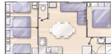
COTTAGE 6P./3KMRS. STANDARD en CONFORT - 32 M 2