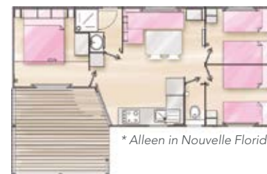
COTTAGE 6P./3CH.* CONFORT - 34 M 2

Woonkamer met zit/slaapbank (2-persoonsbed, 140 cm)