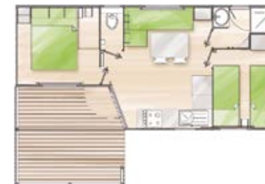
COTTAGE 4-6P./2KMRS. STANDARD - 27 TOT 30 M 2